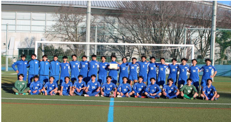
2023年度51回SFAカップU-18優勝 神奈川県立相模原弥栄高等学校